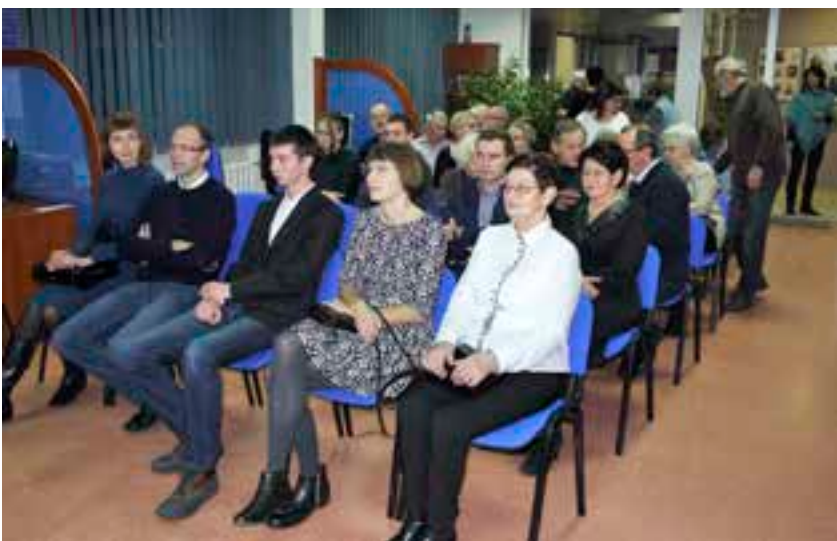
■ Fot. T. Rybarczyk