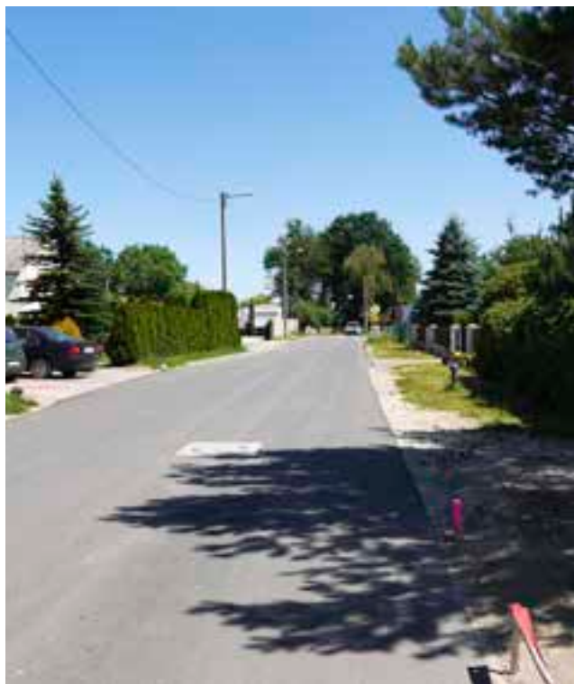
Rabowice, ul. Olszynowa.