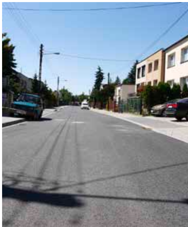
Swarzędz, ul. Osiedlowa.