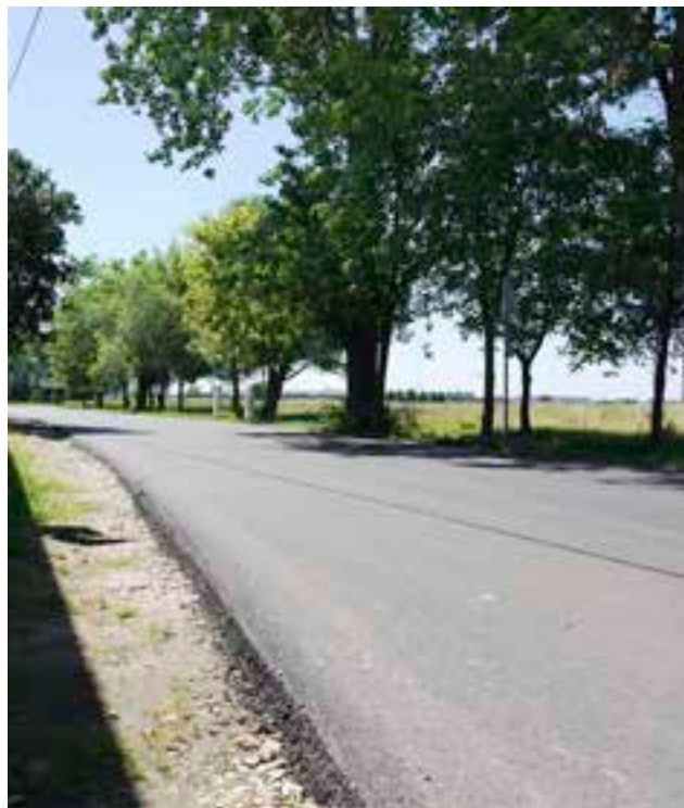
Rabowice, ul. Bukowa.