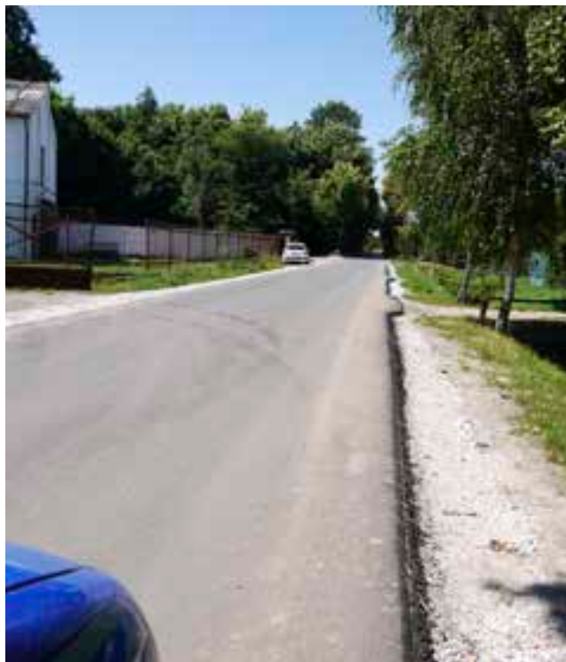
Kruszwania, ul. Spółdzielcza.