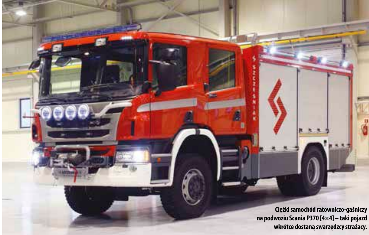
Ciężki samochód ratowniczo-gaśniczy na podwoziu Scania P370 [4x4] – taki pojazd wkrótce dostaną swarzędzcy strażacy.

Samochód dla strażaków – dostawa w czerwcu. Jak już informowaliśmy w marcowym wydaniu PzR, Gmina Swarzędz otrzymała 800 tys. zł dofinansowania na zakup ciężkiego samochodu ratowniczo-gaśniczego wraz z wyposażeniem dla OSP we Swarzędzu. Umowa o dofinansowanie została podpisana 2 lutego 2015 roku, a 27 marca rozstrzygnięto przetarg na dostawę pojazdu. Wygrała firma SZCZĘŚNIAK Pojazdy Specjalne Sp. z o. o. z Bielska-Białej. OSP w Swarzędzu powinna otrzymać nowy samochód ratowniczo-gaśniczy w pierwszej połowie czerwca 2015 roku. Samochód będzie garażowany w nowej siedzibie strażaków ochotników ze Swarzędza, która znajduje się przy ul. Dworcowej 24.