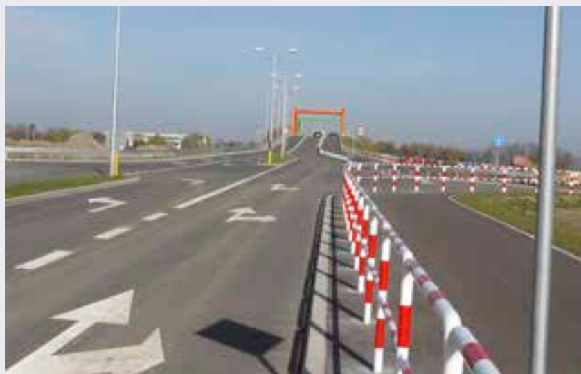
Budowa drogi łączącej ul. Rabowicką z drogą krajową nr 92 w Jasiniu – etap II.

► Budowa chodników i zatok autobusowych przy drogach powiatowych – zadanie wieloletnie 2010-2014, znajdujące się w WPF. Plan na 2014 rok wynosi 80.000 zł, na realizację II etapu inwestycji, na podstawie opracowanej w roku 2013 dokumentacji technicznej. dok. na s.6 ➔