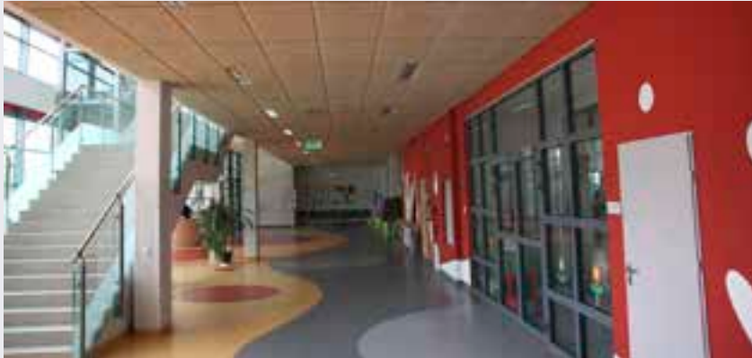
Budowa Szkoły Podstawowej w Zalasewie.