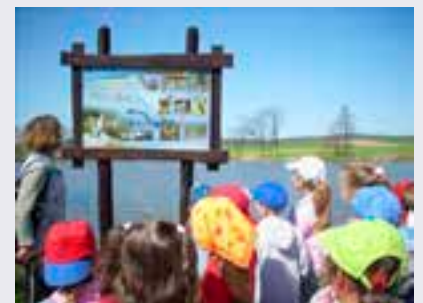
Budowa sieci ścieżek rowerowych i punktów widokowych w Dolinie Cybiny.