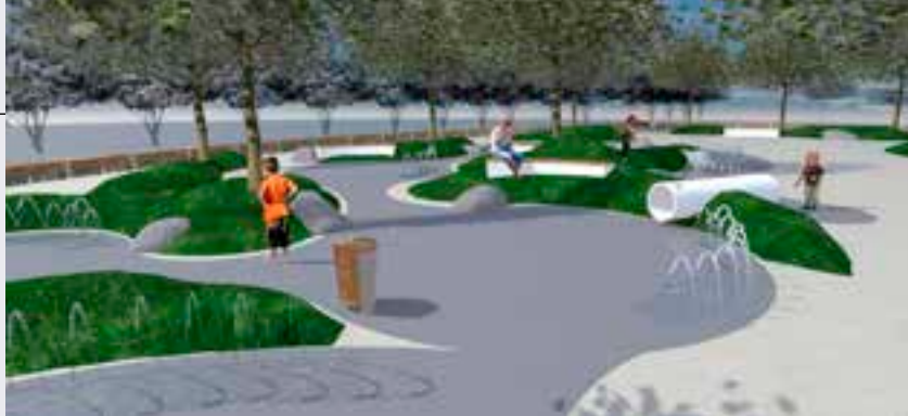
Rewitalizacja terenów południowej części miasta Swarzędz (os. Raczyńskiego).

► Budowa systemu informatycznego dla potrzeb integracji systemów informatycznych jednostek Gminy Swarzędz - zadanie majątkowe jednoroczne. Na zakup urządzeń na potrzeby integracji