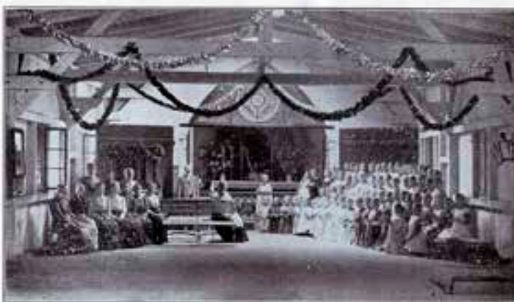
Jadalnia na Kolonii w Kobylnicy. Wewnątrz otwarta kaplica św. Krzyża.

Wkończającym się 2013 r. – 29 września minęło 110 lat od śmierci ks. Wincentego Studniarskiego - proboszcza w Kicinie i Wierzenicy w latach 1864-1903. Parafie te połączone były wówczas unią personalną, wierzenicką administrował proboszcz kiciński. Ta sama liczba 110 lat odnosi się też do początku istnienia świątyni w Kobylnicy należącej od kilku wieków do parafii w Wierzenicy. Ostatnie lata posługi ks. Studniarskiego to czas kiedy w Kobylnicy rozpoczęła swoją