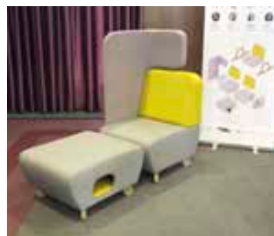
Fotel z miejscem dla kota (wyprodukowany przez firmę Wimeb),