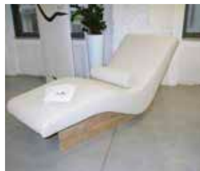
Szezlong (wyprodukowany przez firmę Aris Concept),