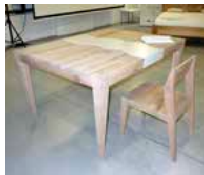
Stół z krzesłami (wyprodukowany przez firmę Meble Maćkowiak).