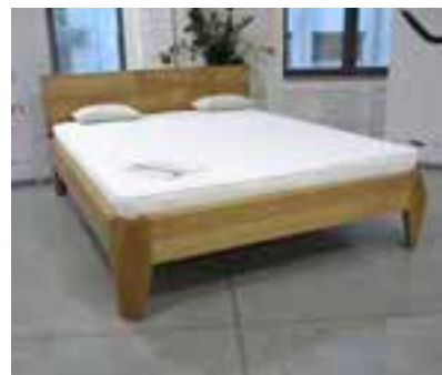
Łóżko (wyprodukowane przez firmę Meble Szymański),