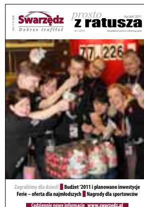
■ Fot. H. Błachnio

Filia Wydziału Komunikacji i Transportu Swarzędz, ul. Poznańska 25. tel. 61 651 12 65 lub 651 12 68 Filia przyjmuje klientów: w poniedziałek w godzinach: od 9:00 do 16:30, wtorek-piątek od 8:00 do 15:00.