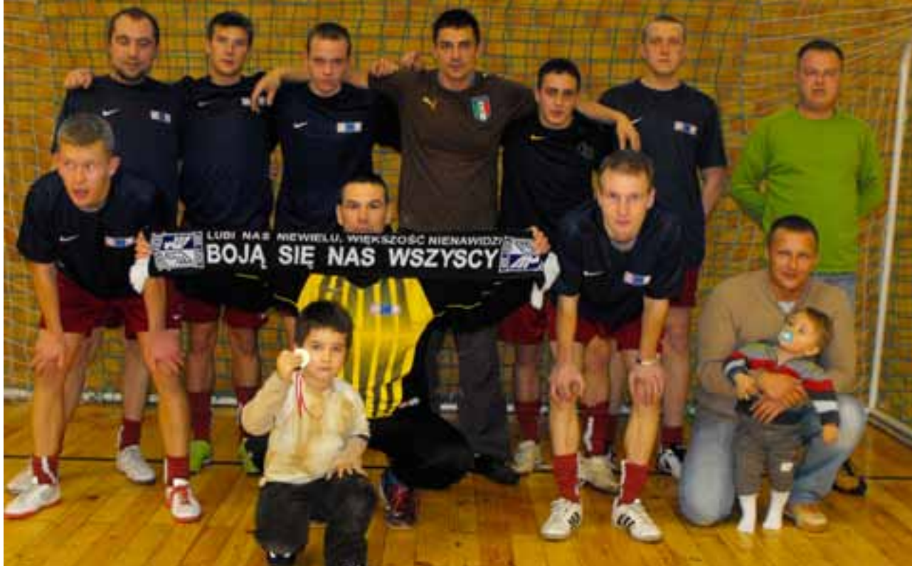
Zwycięska drużyna Swarzędzkiego Centrum Ubezpieczeń