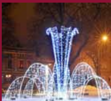
Na zdjęciu: instalacja świetlna ustawiona na zimę w miejscu fontanny.