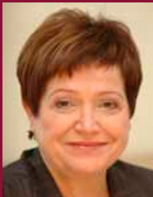
Burmistrz Bożena Szydłowska