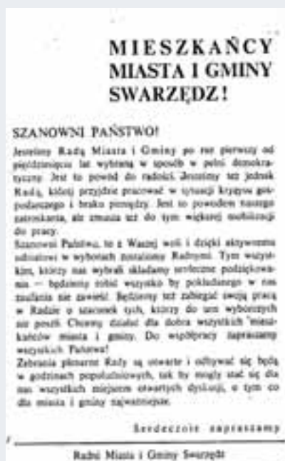
Pierwsze wydanie „Prosto z Ratusza” z odezwą radnych do mieszkańców Swarzędza.

Rada na swym pierwszym posiedzeniu przyjęła list do „Mieszkańców Miasta i Gminy Swarzędz!”. W swym liście członkowie Rady podziękowali mieszkańcom za aktywny udział w wyborach i zadeklarowali, że będą też „zabiegać