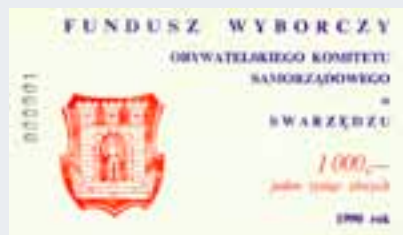
Cegielka Funduszu Wyborczego Obywatelskiego Komitetu Samorządowego.