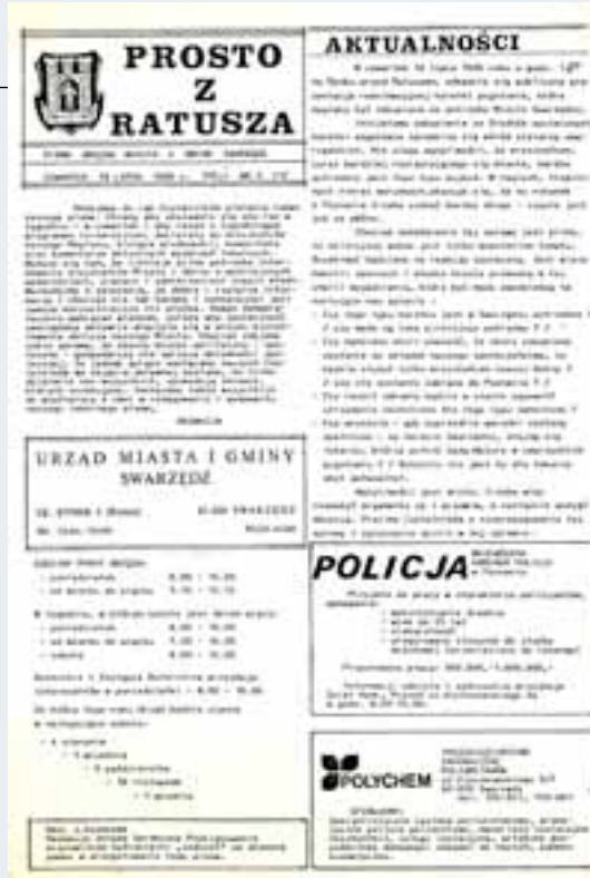
Strona tytułowa pierwszego wydania „Prosto z Ratusza” sprzed 20 lat. Gazeta miała cztery strony, w tym dwie z programem telewizyjnym...