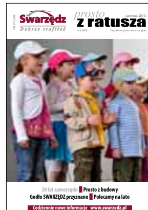
■ Fot. H. Błachnio

Filia Wydziału Komunikacji i Transportu w Swarzędzu Swarzędz, ul. Poznańska 25. tel. 61 651 12 65 lub 651 12 68 Filia przyjmuje klientów: w poniedziałek w godzinach: od 9:00 do 16:30, wtorek-piątek od 8:00 do 15:00.