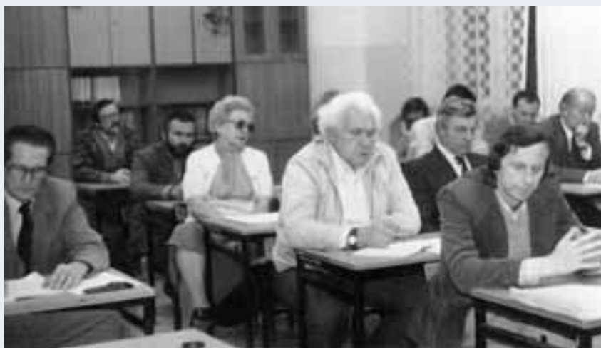
Spotkanie przedwyborcze z mieszkańcami zorganizowane przez OKS w sali Szkoły Podstawowej nr 1.

Funkcjonująca w latach 1988-1990 Rada Narodowa Miasta i Gminy w Swarzędzu liczyła 60 radnych, nowa ustawa dawała gminie Swarzędz połowę tych miejsc mandatowych. W majowych wyborach nasza gmina została podzielona na 30 jednomandatowych okręgów wyborczych. O te miejsca w Radzie Miejskiej ubiegało się 120 kandydatów, z których połowę należy określić jako niezależnych. Spośród tych, których rekomendowała jakaś organizacja, najwięcej kandydatów reprezentowało Obywatelski Komitet Samorządowy – 26, Cech Stolarzy – 15 (ale aż trzech w okręgu nr 7), Klub Swarzędz 2000 – 9, Stronnictwo Demokratyczne – 5, Klub Sportowy „Unia” – 4, Polski Związek Wędkarski – 5, Polskie Stronnictwo Ludowe – 2 (choć członkami PSL było jeszcze 5 kandydatów), Unia Polityki Realnej – 1, Stowarzyszenie