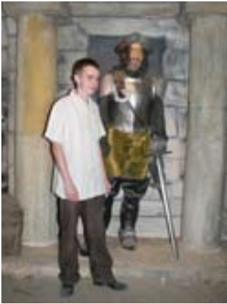
Tomek i konkwistador.

To już 15 lat zarząd Główny Polskiego Towarzystwa Turystyczno-Krajoznawczego i czasopismo „Poznaj swój kraj” organizują Ogólnopolski Młodzieżowy Konkurs Krajoznawczy „Poznajemy Ojcowiznę”. Prace konkursowe obejmują szeroko pojętą tematykę dziejów ziemi ojców widzianej z perspektywy własnej rodziny,