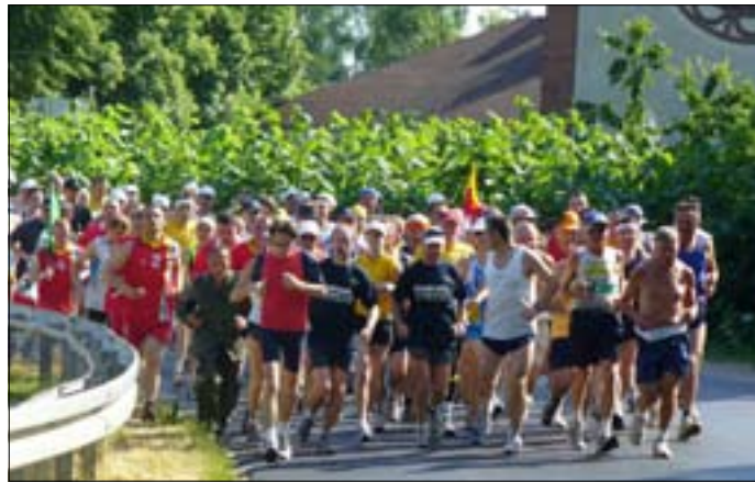
Biegacze koło szkoły w Wierzonce