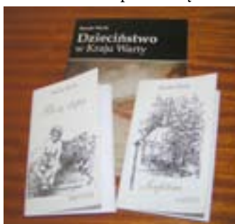
Prezentowane utwory literackie

Galeria funkcjonuje w siedzibie Katolickiego Stowarzyszenia „Civitas Christiana” w Poznaniu przy ul. Kramarskiej 2. Wystawa ta jest jedną z form wypełniania misji Stowarzyszenia w sferze kultury i edukacji z ukierunkowaniem na rodziny wielodzietne. Większość obecnych na jej otwarciu stanowiły mamy co najmniej czwórki dzieci. Miały one, a potem ich dzieci zapoznać się z róż-