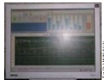
Dane wysyłane przez małże analizowane są przez komputer, na którego monitorze stale widać aktualną sytuację w ujęciu wody.