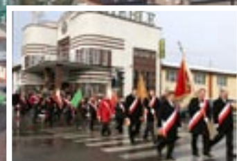
Święto Patrona – str.3