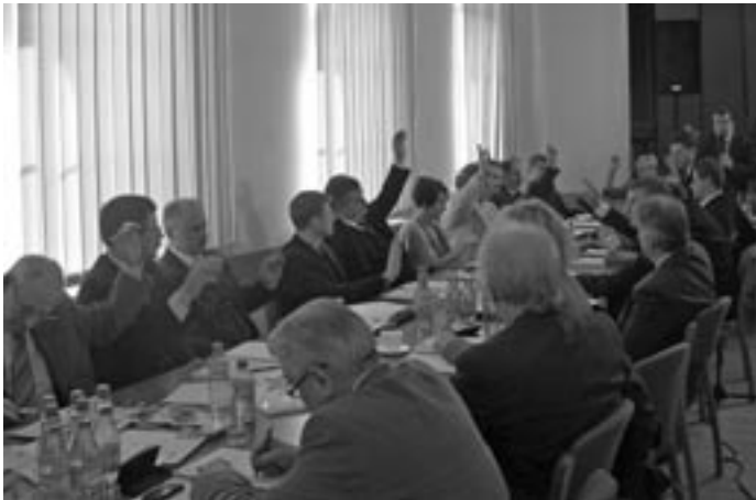
Radni zgodnie głosowali za udzieleniem Burmistrzowi absolutorium.

Program XXIII sesji Rady Miejskiej, która odbyła się 22 kwietnia był obszerny, ale obrady przebiegały bardzo sprawnie. Jednym z głównych punktów było podjęcie uchwały w sprawie udzielenie absolutorium Burmistrzowi. Po zapoznaniu się z opiniami o wykonaniu budżetu za 2007 rok przygotowanymi przez Regionalną Izbę Obrachunkową oraz Komisję Budżetu i Komisję Rewizyjną Rady Miejskiej Swarzędza, radni jednogłośnie uchwalili ab-