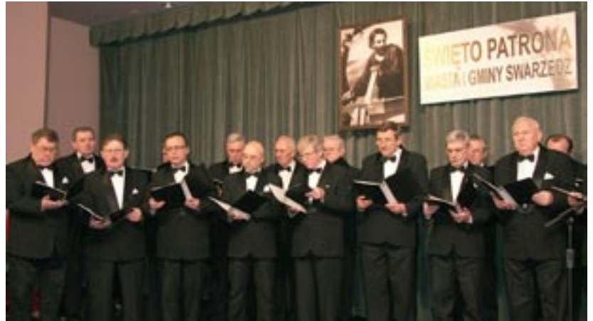
Chór „Akord” podczas tegorocznego Święta Patrona Miasta i Gminy Swarzędz.