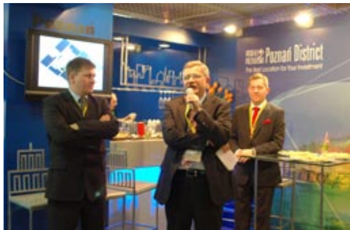
Stoisko Powiatu Poznańskiego.

Targi Nieruchomości MIPIM w Cannes przyciągają uwagę największych inwestorów z całego świata. Wśród tegorocznych wystawców byliśmy obecni, jako jedyny powiat z Polski, prezentując na wspólnym stoisku z miastem Poznań ofertę sześciu podpoznańskich gmin: Buku, Tarnowa Podgórnego, Pobiedzisk, Stęszewa, Murowanej Gośliny i Rokietnicy.