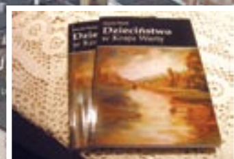
Kolejne rozdziały w środku wydania