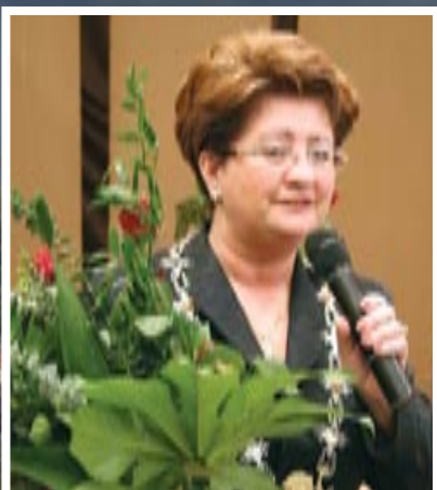
Zaprzysiężenie nowego burmistrza – str.3