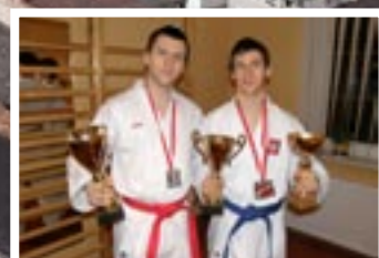
O sporcie – str.16-17