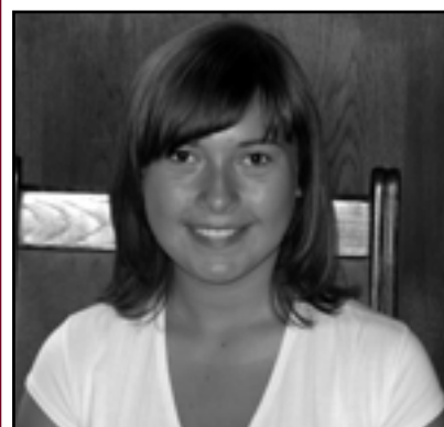
● Ośmiu Wspaniałych s. 16