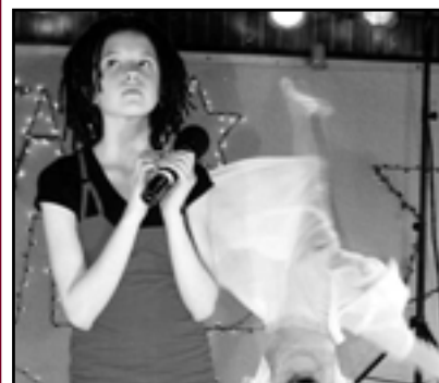
● Gwiazdy i gwiazdki s. 6