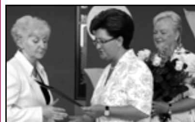
● Szkolne pożegnania s. 9