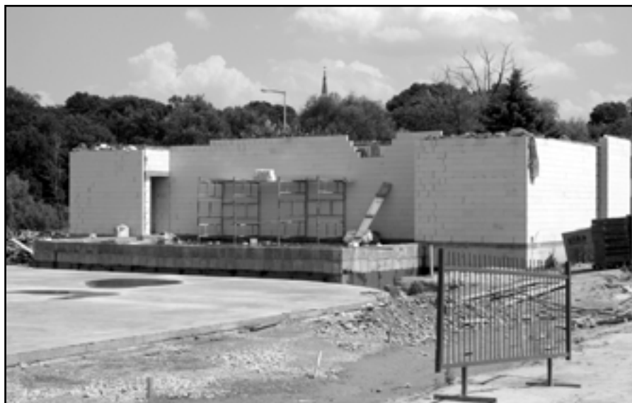
Na budowie sceny plenerowej i lodowiska przy Pływalni „Wodny Raj” w Swarzędzu.