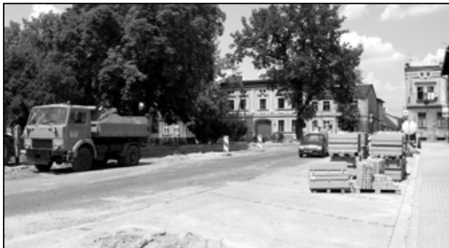
Na placu Niezłomnych w Swarzędzu powstaje porządna zatoka autobusowa.