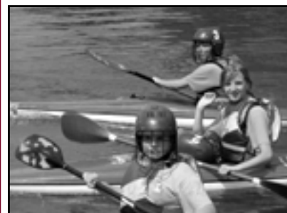
● Juniorki na podium s. 19