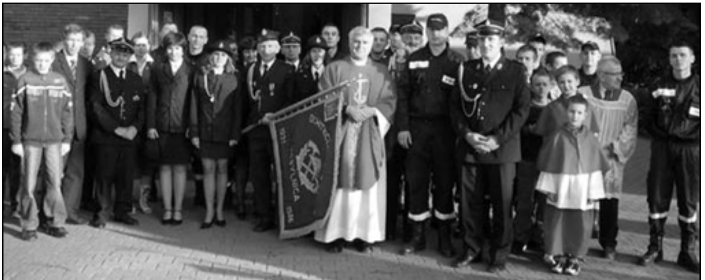
Słaba rozdzielczość !!!

Ochotnicza Straż Pożarna w Kobylnicy działa już 75 lat. Uroczystość z okazji jubileuszu odbyła się 18 czerwca. Po mszy w kościele p.w. Świętego Krzyża strażacy wraz z gośćmi udali się na uroczysty apel, podczas którego jednostka OSP w Kobylnicy otrzymała brązowy medal za zasługi dla pożarnictwa, a najbardziej zasłużeńi druhowie - odznaczenia.