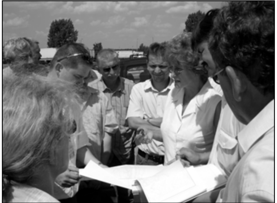
Wkrótce ul. Kirkora stanie się wielkim placem budowy. Powstanie tu tunel pod torami kolejowymi.

klienta. Oznacza to dla swarzędzan duże udogodnienie, gdyż - bez konieczności błąkania się po ratuszowych korytarzach i piętrach - sprawnie, w jednym miejscu będą mogli załatwiać swoje sprawy w UMiG. Z kolei remont III piętra (poddasza) w ratuszu to inwestycja, która pozwoli na stworzenie tam wreszcie warunków do normalnej pracy. Chodzi o założenie izolacji cieplnej dachu (pomieszczenia zimą są niedogrzane, a latem zamieniają się w „piekarnik”) i wstawienie kilku niezbędnych okien.