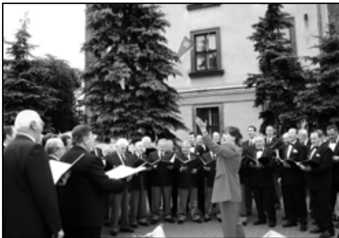
Chóry Concordia i Akord podczas wspólnego występu.