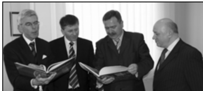
Spotkanie Zarządu Powiatu Poznańskiego z gościem z Holandii.

Dyrektor Wydziału Integracji Europejskiej, Promocji i Kultury