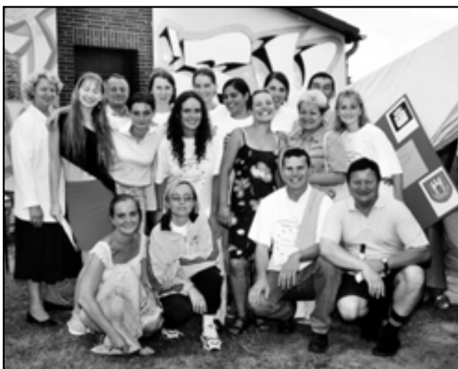
Uczestnicy jednego z letnich obozów młodzieżowych