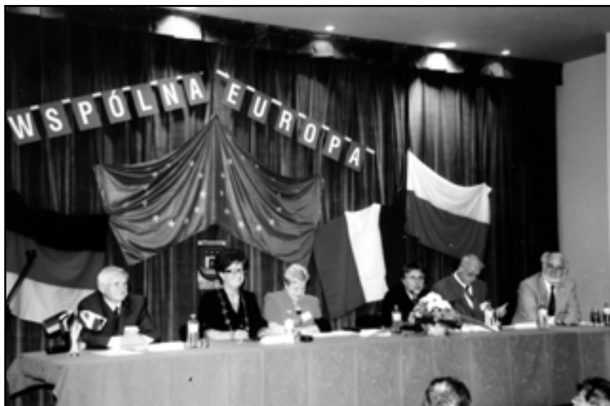
Uroczysta sesja Rady Miejskiej Swarzędza z okazji wstąpienia Polski do Unii Europejskiej.