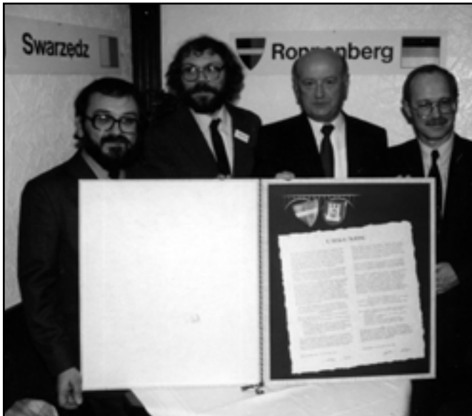
Podpisanie dokumentu o współpracy.