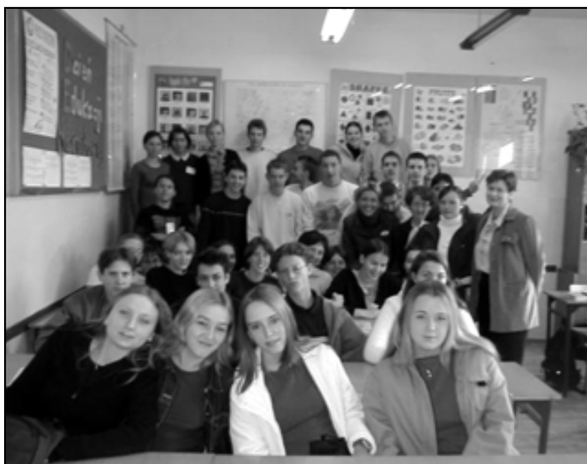
Młodzież z Ronnenbergu w II LO w Swarzędzu.