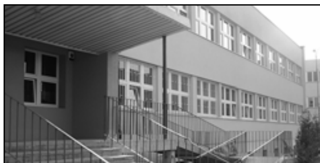
Budynek Zespołu Szkół w Bolechowie po termomodernizacji.

Wydział Integracji Europejskiej, Promocji i Kultury